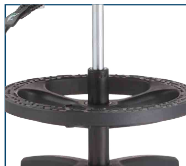
Base nylon de 300mm de radio