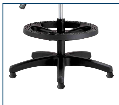
Base nylon de 325mm de radio