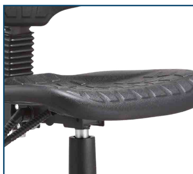
Asiento goma suave