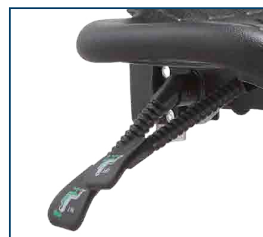
Mecanismo reclinable multiposiciones