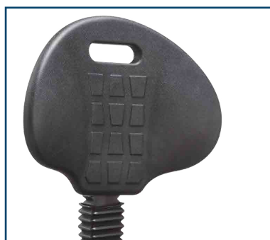
Respaldo goma suave